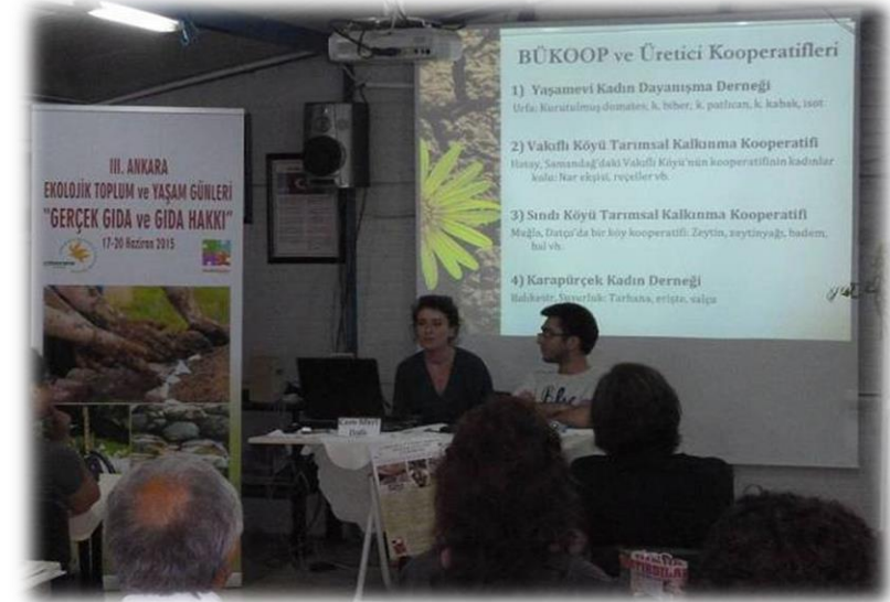
Tüketici Kooperatifleri BÜKOOP C. M. Dallı/R. Önoğlu