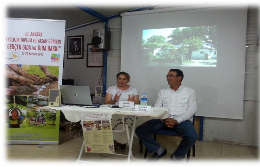
"Eklj. Üretim ve Tüketiciye Katkıları" S.S. Tanal