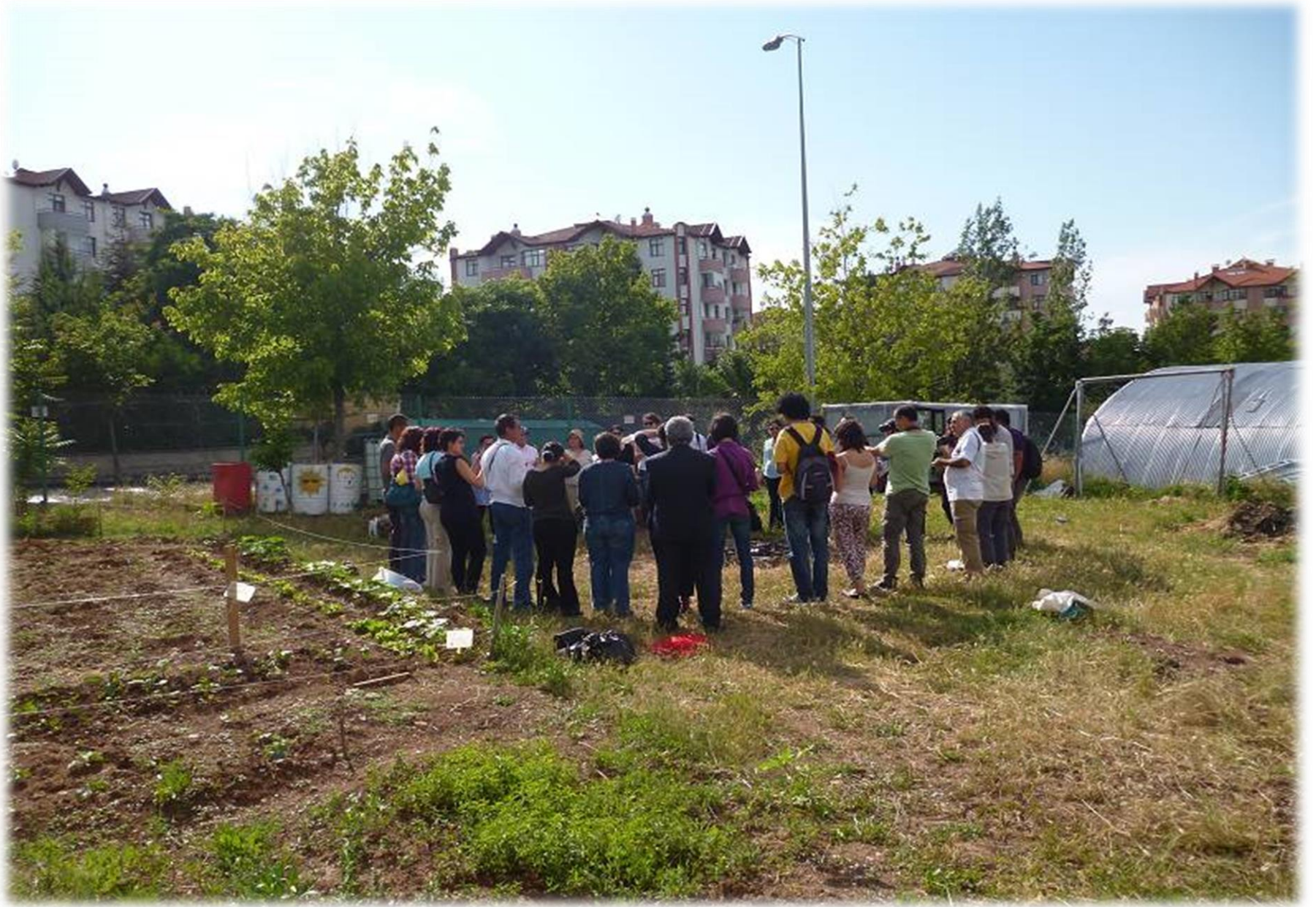
Bostan da Tanışma ve Açılış Etkinliği