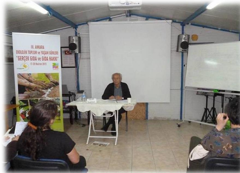
Kapitalizm ve Gıda Sistemi F. Başkaya